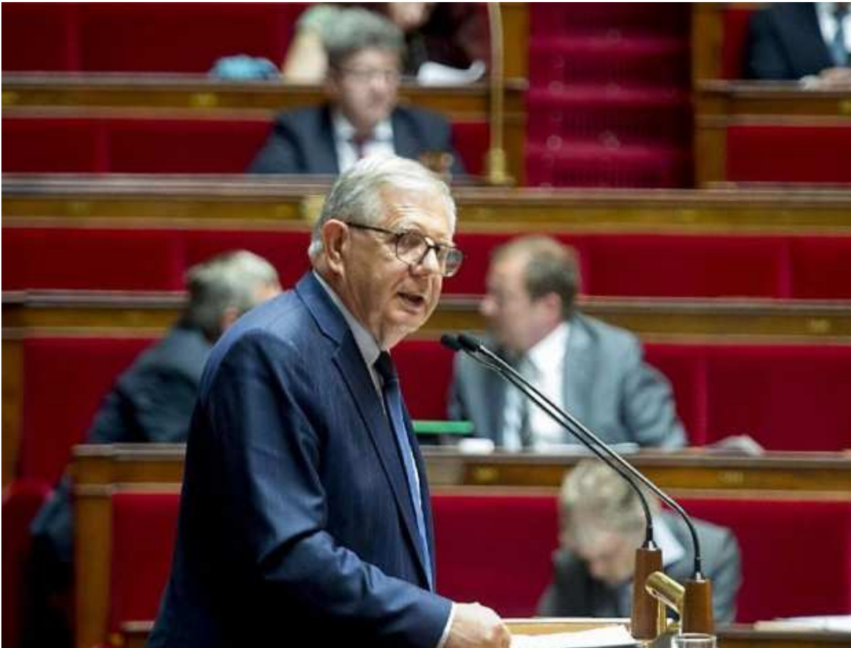
Le ministre de la Cohésion des territoires Jacques Mézard.

PROMULGATION. Jacques Mézard, ministre de la Cohésion des territoires, s'est félicité de la publication de la loi pour un État au service d'une société de confiance (Essoc), qui acte notamment le principe de la réécriture du code de la construction et de l'habitat par le "permis d'expérimenter".