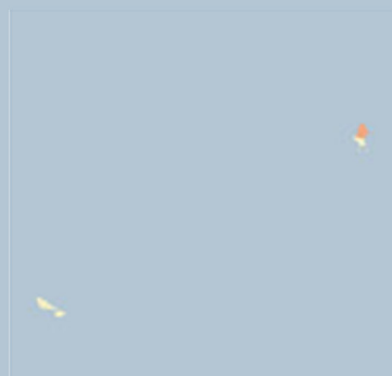
Wallis et Futuna