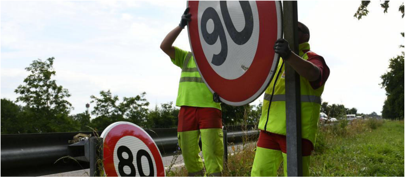
Les employés de la Direction interdépartementale des routes de l'Est remplacent un panneau de limitation à 90 km/h par un panneau 80 km/h, à Wittenheim (Haut-Rhin), le 29 juin 2018.

La Haute-Marne doit voter ce vendredi le retour prochain aux 90 km/h sur une partie du réseau routier. Il s'agit du premier département à prendre une telle initiative depuis l'annonce de l'assouplissement de la limitation de vitesse à 80 km/h par Edouard Philippe.